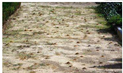
Massenvorkommen der Raufußigen Hosenbiene