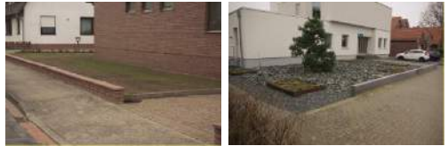
Lebensraum für Wildbienen?