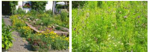
Besser so! © Manfred Radtke