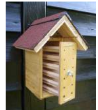
Beobachtungsröhren aus atmungsaktivem Holz, nur teilweise mit Acrylglas abgedeckt

Markhaltige Stängel, die man waagrecht anbringt, werden von Wildbienen in der Regel nicht angenommen (s. Abschnitt 3.8)